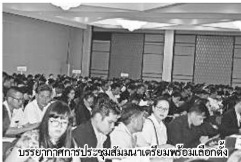
บรรยากาศการประชุมสัมมนาเตรียมพร้อมเลือกตั้ง

"กระทรวงเกษตรฯ ได้ดำเนินตามนโยบายของคณะกรรมการกองทุนฟื้นฟูและพัฒนาเกษตรกรเฉพาะกิจตามคำสั่งคสช.ที่ 26/2560 ลงวันที่ 18 มกราคม 2560 โดยให้ดำเนินการตามภารกิจ 3 เรื่องด้วยกัน ได้แก่ 1.การแก้ไขปัญหาหนี้เร่งด่วน 2.การแก้ไขปัญหาภายในของสำนักงานกองทุนฟื้นฟูและพัฒนาเกษตรกร (กฟก.) และ 3.การได้มาซึ่งคณะกรรมการกองทุนฟื้นฟูสำหรับการได้มาซึ่ง