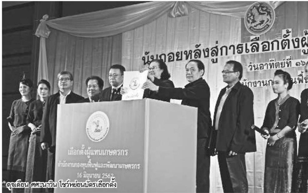
ดูจเดือน ศศະนาวิน ไชวหยังอนบัตรเลือกตั้ง